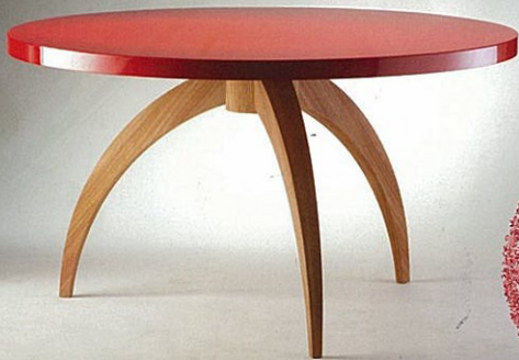
DREISTELLIG für sieben Personen: Esstisch „New York 09“ (H 78 cm, Ø 140 cm) mit glänzend rot oder schwarz lackierter Tischplatte und Gestell aus naturbelassenem Ulmenholz. Von Versace Home, 13.000 €.