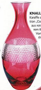
KNALLZART Karaffe aus der Kollektion „Colours“ (Ø 7 l) aus rotem oder klarem Kristallglas. Von Theresienthal, 175 €.