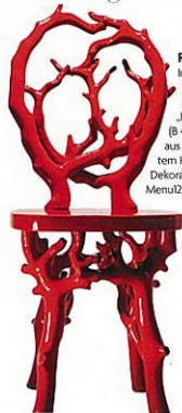
ROYAL RED Inspiriert vom Mobiliar Ludwigs II: „Korallenstuhl“ (B 40 x T 40 cm) aus rot lackiertem Holz. Von Alte Dekorationen über Menu2, 1200 €.