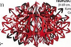
TEUFLISCH Hängelampe „Devil“ (H 69 cm, Ø 115 cm) aus rotem Kunststoff. Design von Nigel Coates für Slamp, 998 €.

IMMER EINE REISE WERT Vom 18. September an präsentiert das Londoner Victoria & Albert Museum in neuen Ausstellungsräumen die weltweit umfassendste Keramiksammlung. vam.ac.uk .