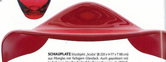
SCHAUPLATZ Sitzobjekt „Scuba“ (B 220 x H 77 x T 88 cm) aus Fiberglas mit farbigem Glanzlack. Auch gepolstert mit Lederbezug. Von Brodie Neill für Domodinnamica, ab 4900 €.