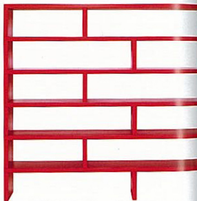
RAUMORDNUNG Regal „Sign“ (H 142 x B 154 x T 33 cm) aus laetem MDF mit drehbaren Zwischenwänden. In acht Farben und verschiedenen Holzern. S. Lindström für Karl Andersson & Söner, 1500 €.